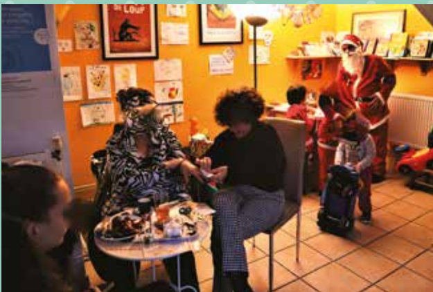
Le père Noël est aussi passé à la Petite maison-Madeleine Perret