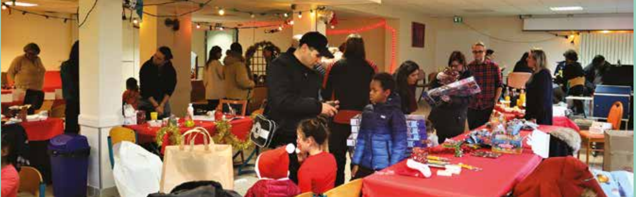
La résidence Camus a accueilli un « marché de Noël » pour toutes les structures d'hébergement