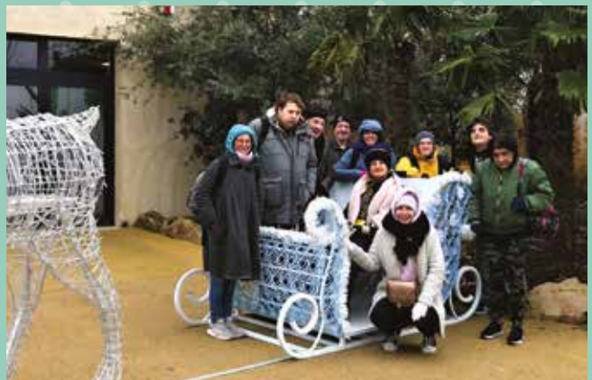
Des pensionnaires de Dolbeau ont choisi d'aller au zoo de Beauval