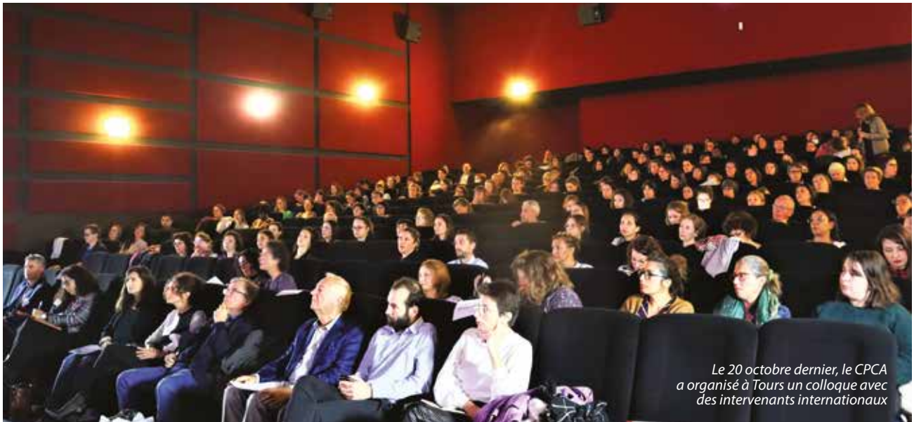
Le 20 octobre dernier, le CPCA a organisé à Tours un colloque avec des intervenants internationaux

312 192 euros pour l'ensemble des activités du CPCA Centre-Val de Loire. Le montant a doublé en 2022 pour le déploiement des trois derniers départements (Cher, Eure-et-Loir et Indre). Des co-financements sont recherchés chaque année auprès du Fonds d'intervention pour la prévention de la délinquance (FIPD), du Conseil local de sécurité et de prévention de la délinquance (CLSPD), de la Justice et des collectivités. Pour l'Indre-et-Loire en 2022, le FIPD a accordé 15 000 euros, le Ministère de la Justice (SPIP) 7 000 euros et le CLSPD d'Amboise 2 000 euros.