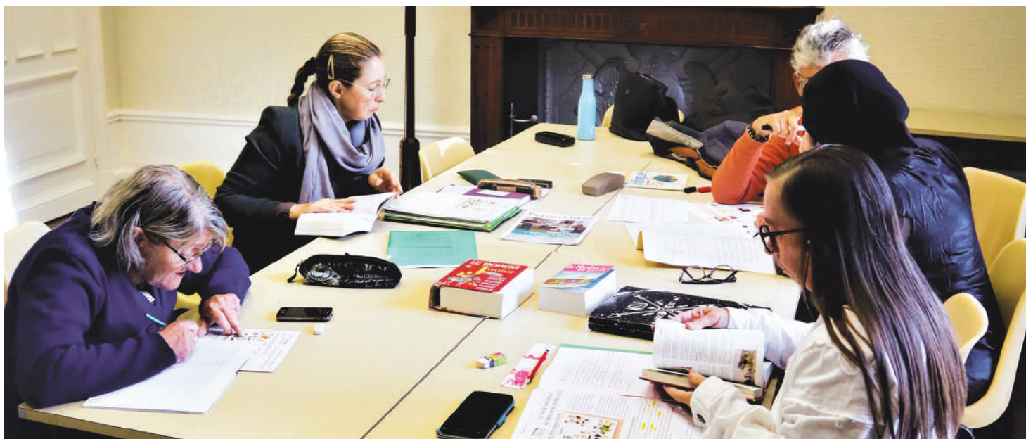
Des « apprenants » à Château-Renault sous l'égide d'Entraide et Solidarités