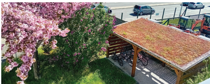
Parmi nos savoir-faire, la végétalisation des toits

• Éco-transition : un secteur où les communes devraient investir de plus en plus, non seulement pour la voirie et les réseaux divers, la pose de clôtures et portails, de toitures végétalisées, mais surtout pour la préservation de l'eau, un enjeu majeur pour lutter contre le ruissellement et l'artificialisation des sols dans les agglomérations. L'association a acquis un savoir-faire reconnu depuis plusieurs années maintenant dans l'installation de récupérateurs d'eau, et la perméabilisation des sols. ecotransition@entraide-et-solidarites.fr