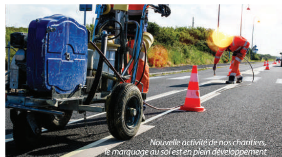
Nouvelle activité de nos chantiers, le marquage au sol est en plein développement

Contact Entraide et Solidarités 40, rue Augustin-Fresnel 37170 Chambray-lès-Tours 02 47 27 62 84 emploi@entraide-et-solidarites.fr