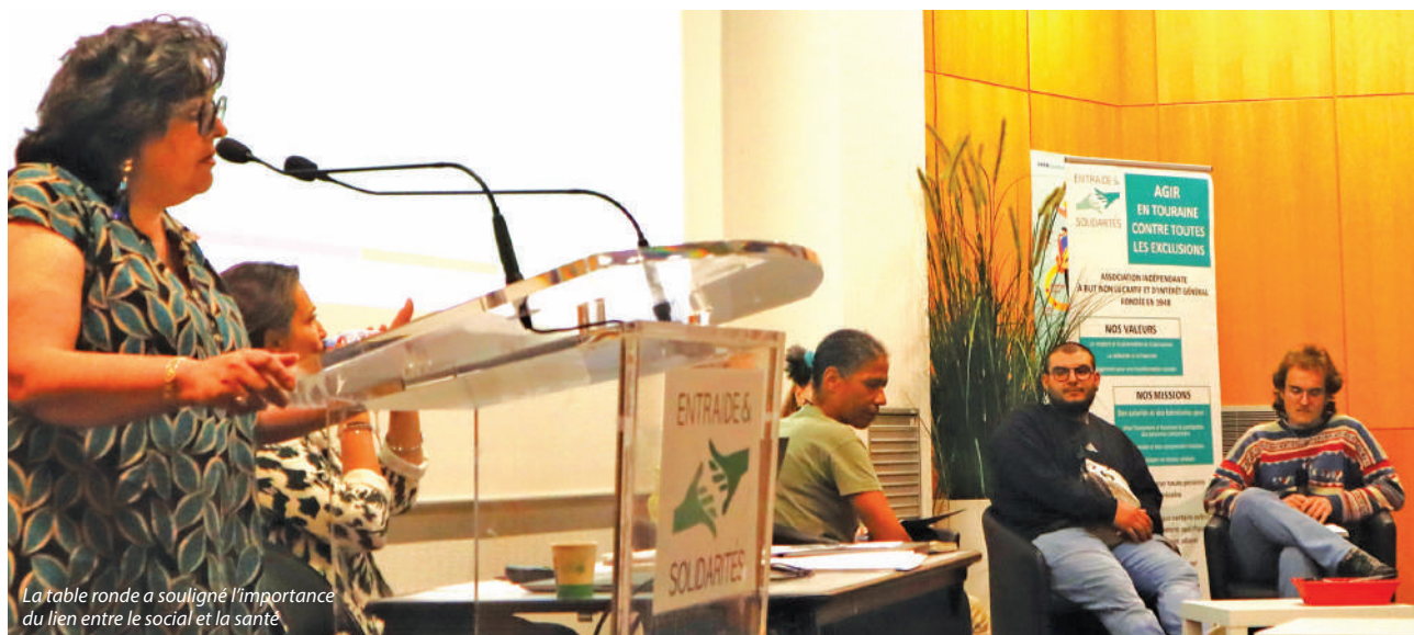
La table ronde a souligné l'importance du lien entre le social et la santé.